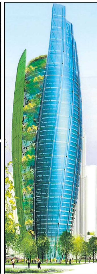
(rechts) en Villa Flora (beneden)